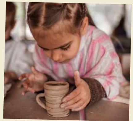
Des pots à crayons

Tu t'es bien amusé(e) ? Tu aimerais en faire d'avantage ?