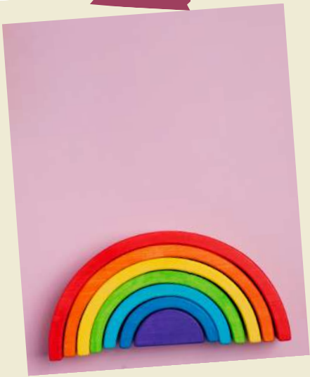
Un arc en ciel