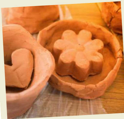
Des fleurs et motifs