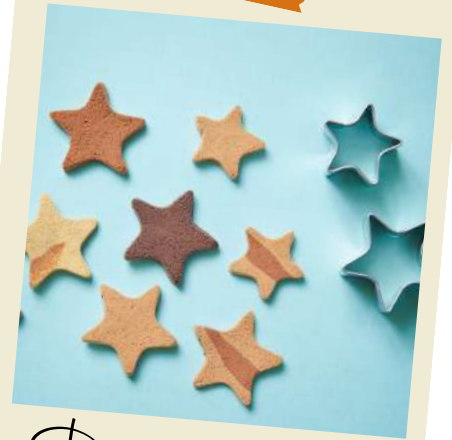
Des étoiles à suspendre

A toi d'imaginer tout ce que tu peux fabriquer avec cette argile !